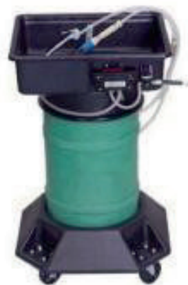
Fontaine mobile de nettoyage des freins