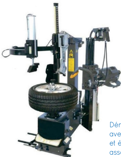
Démonte pneu avec bras d'assistance et élévateur de roues associé