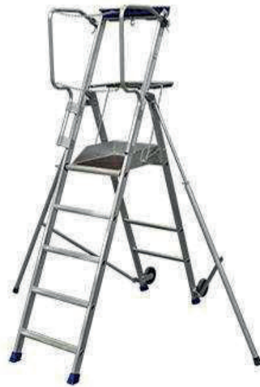
Plateforme individuelle roulante légère (PIRL)