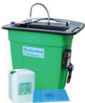
Fontaine fixe de dégraissage des pièces mécaniques