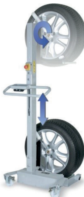
Lève-roue mobile (ou élévateur mobile) que l'on peut associer à l'acquisition d'un démonte pneu (doté d'un 3 ème bras)